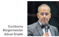
Eschborns Bürgermeister Adnan Shaikh