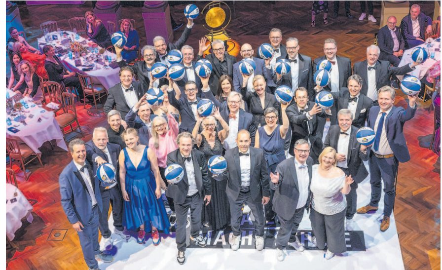
Ein sehr erfolgreicher Abend: Die Paten und Patinnen der 129 Schul-AGs versammelten sich zum Abschluss der Benefiz-Gala auf der Bühne.