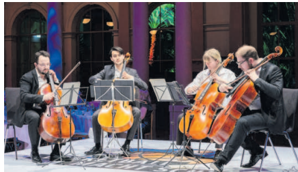
Begeisterten mit ihrem Auftritt: die Junge Deutsche Philharmonie